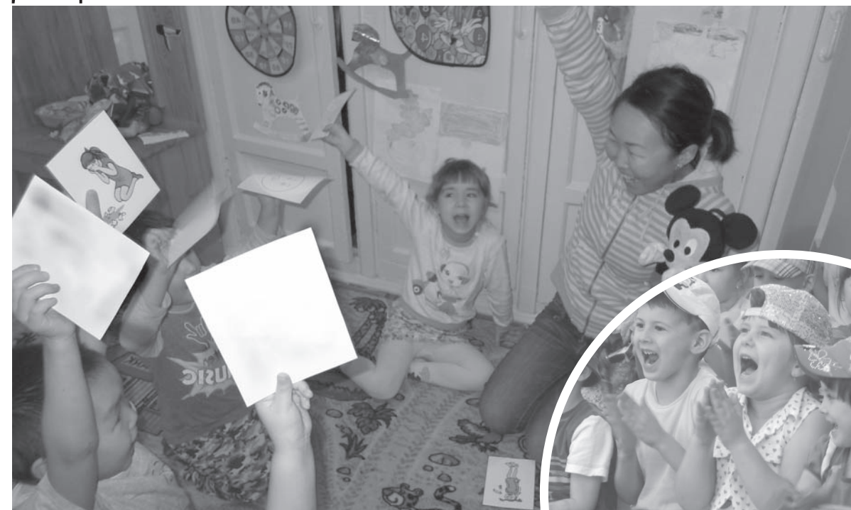
Общаемся на английском в детском саду № 35.

разработке основной образовательной программы с использованием трингвальной (изучение трех языков) технологии.