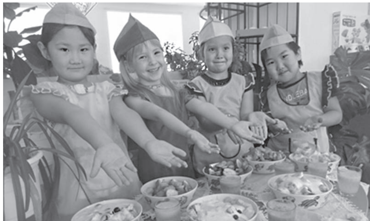
В доброжелательной атмосфере дети помогают друг другу.

позициях с продуктами своего творчества, в народных праздниках, обрядах, играх - результат успешной работы Мастерской декоративно-прикладного искусства и ремесел народов Бурятии «Душа народа моего» для детей, их родителей и семей.